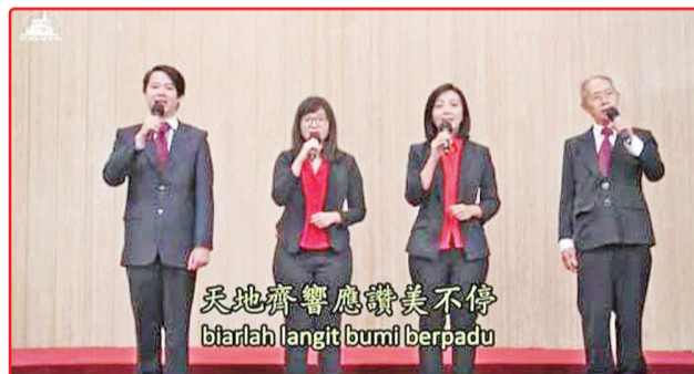
Kidung pujian yang dinyanyikan paduan suara Gereja Injili Indonesia Jemaat Hok Im Tong Bandung.