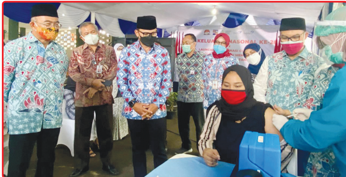
Menko PMK Muhadjir Effendy saat meninjau vaksinasi.