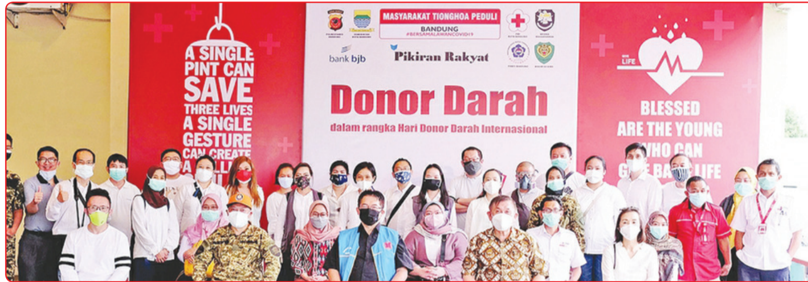
Panitia penyelenggara berfoto bersama pendukung acara dan para relawan.

komunitas Tionghoa masih bersedia keluar untuk melakukan donor darah guna membantu PMI juga membantu menyelamatkan nyawa para pasien yang membutuhkan transfusi darah," tambahnya.