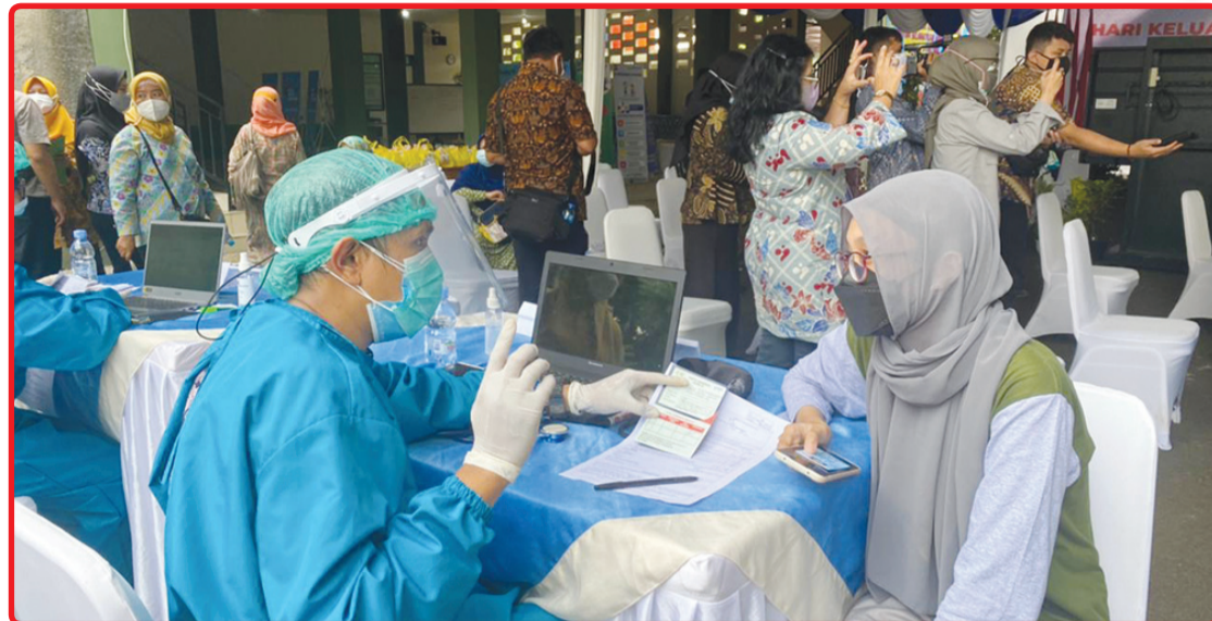
Menko PMK berdialog dengan seorang peserta.