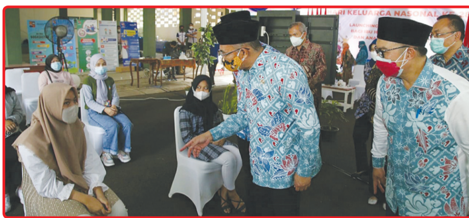
Seorang Ibu saat melakukan proses menuju vaksinasi.

untuk melakukan vaksinasi, karena beliau memang kerjanya sehari-hari melayani para ibu-ibu. Maka semuanya kelihatan lancar-lancar saja," ujarnya. Seraya mendukung pelaksanaan vaksinasi bagi ibu hamil, menyusui, dan anak usia 12-18 tahun. Menurutnya vaksinasi ini akan semakin mempercepat target satu juta vaksinasi per hari sesuai dengan arahan Presiden. Menko PMK mengatakan, ibu hamil, ibu menyusui, dan anak merupakan adalah ke-