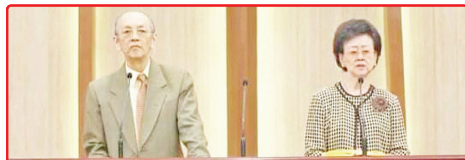
Maka raja-raja di dunia bangkit melawan kehendak Allah dan yang diurapi-Nya,